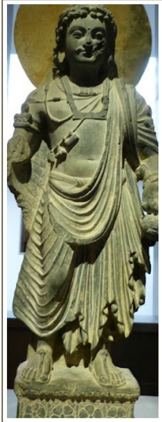
Tượng Di Lạc Nghệ thuật Gandhara thế kỷ thứ 2 (Tây bắc Ấn Độ xưa).

Trên hết là tầng Thượng Thiên. Hồn Ngươn có các vị Cổ Phật như Brahma, Shiva, Christna,... chúng ta liên tưởng đến hình ảnh trên nóc Bát Quái Đài Tòa Thánh có tượng hình 3 vị. Đức Brahma Phật là Thần Sáng Tạo, Đức Shiva Phật là Thần Hủy Diệt, Đức Christna Phật là Thần Bảo Tồn... Đặc biệt là Đức Christna Phật theo tài liệu khảo cứu Ngài cỡi Giao long tuần du trong cõi Ta Bà thế giới dẫu cho chúng sanh nào chết nơi chân trời góc bể, rừng sâu núi thẳm mà tâm thuần lương, hạnh đức trong sáng công nghiệp đủ đầy âm chất, Đức Krishna Phật sẽ tìm rước chơn hồn ấy