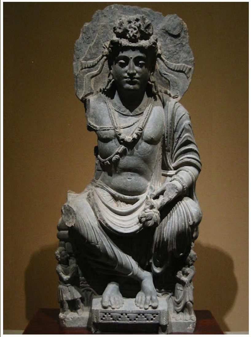
PHẬT DI LẠC CỦA ẤN ĐỘ